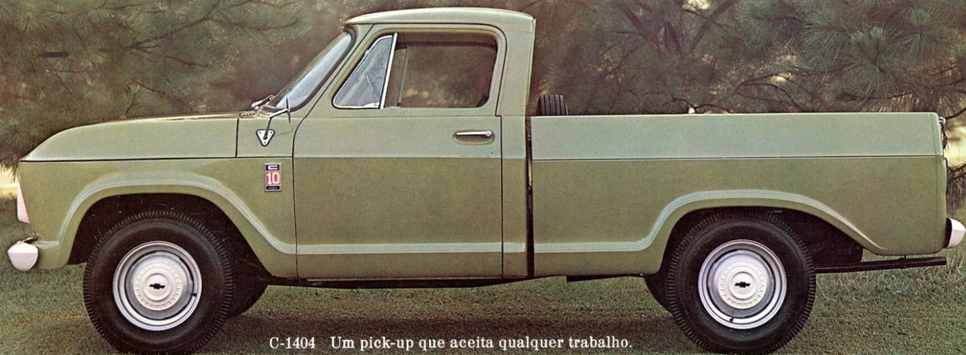
C-1404 Um pick-up que aceita qualquer trabalho.