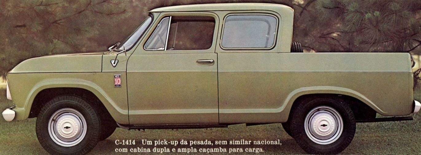
C-1414 Um pick-up da pesada, sem similar nacional, com cabina dupla e ampla caçamba para carga.