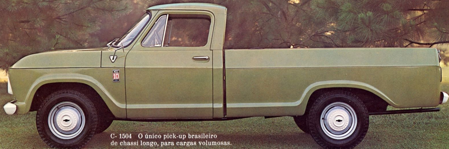
C- 1504 O único pick-up brasileiro de chassi longo, para cargas volumosas.